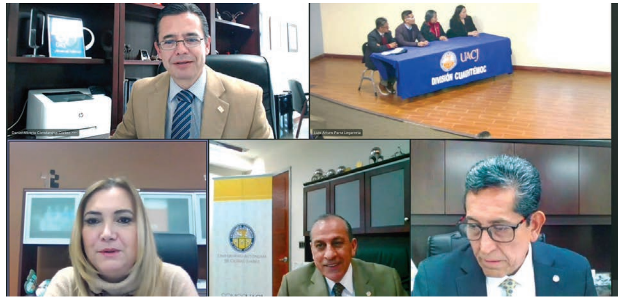
Autoridades universitarias sostuvieron una reunión virtual con los evaluadores del CEPPE.