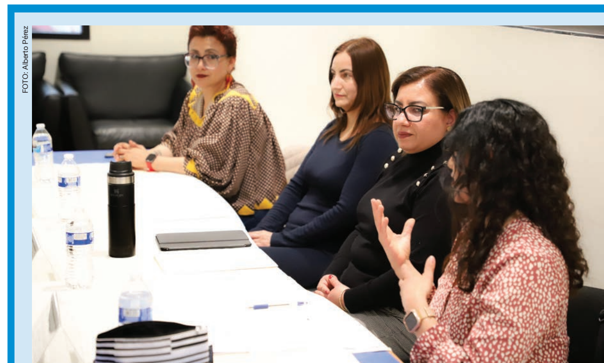
Profesoras investigadoras de diferentes institutos de la UACJ participaron en conversatorio.

Mencionó también que fue la Organización de las Naciones Unidas (ONU) quien institucionalizó en 1975 el Día Internacional de la Mujer como resultado de una larga trayec-