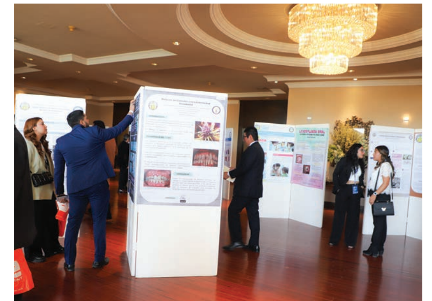
Estudiantes de odontología participaron en concurso de carteles que se expusieron en el congreso.

Dio a conocer que, además de las conferencias magistrales de ponentes de prestigio internacional, se llevó a cabo una exposición de carteles científicos realizados por estudiantes de pregrado. En la exposición participan 72 carteles y se efectuó una premiación para los mejores.