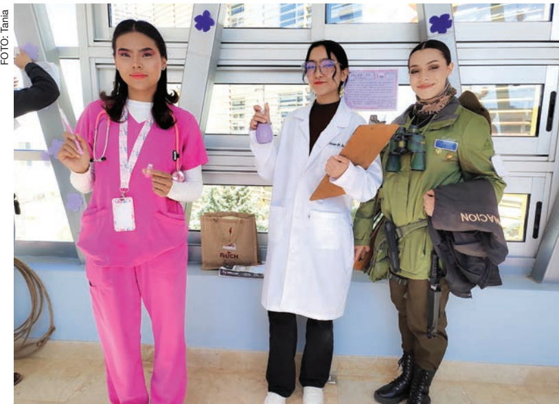
Alumnas organizaron actividades en el campus para fomentar la equidad de género.