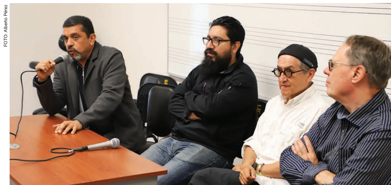
Los integrantes del Ensamble Sarabanda durante la reunión que tuvieron con estudiantes.

secretario de Extensión y Cultura Universitaria de la UAQ y quien organiza este festival, platicó cómo desde hace un año se formaba la idea de lograr hacer en conjunto este proyecto. Ahora Ciudad Juárez también fue sede por un día de este evento internacional.