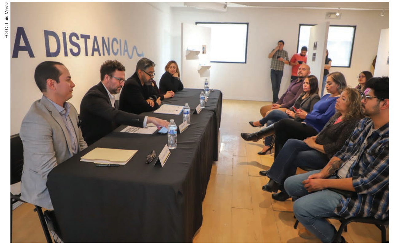
En el IADA se presentó el libro Cambios de paradigmas en el uso del espacio.