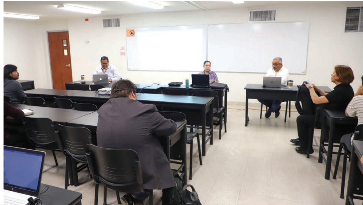
La mesa de análisis formó parte de las actividades realizadas con motivo del 8 de Marzo

"De tal forma que los trabajos que se incluyen en esta mesa tienen que ver precisamente con esa articulación; cuál es la dinámica dentro del quehacer deportivo como un elemento cultural con implicaciones de género. Es decir, violencias, tra-