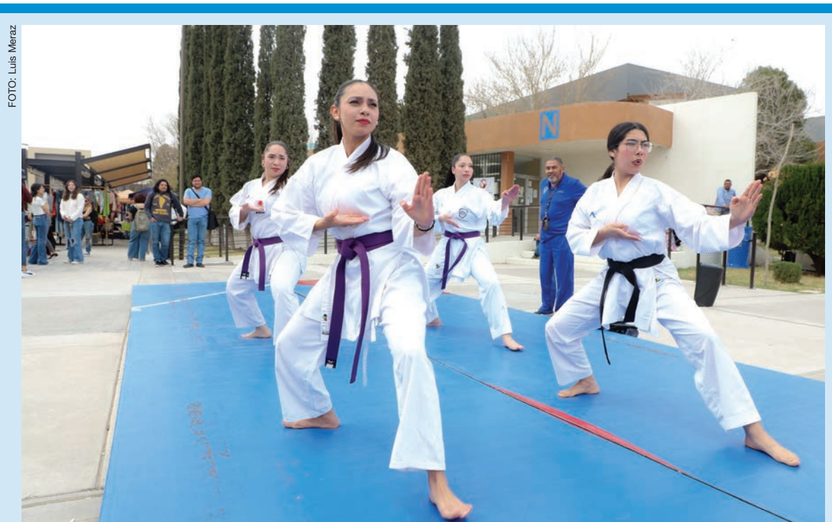
Atletas de diferentes artes marciales mostraron técnicas básicas de autodefensa.

Presentó la definición de violencia política contra las mujeres en razón de género, de acuerdo con la Ley General de Acceso de las Mujeres a una Vida Libre de Violencia: "ac-