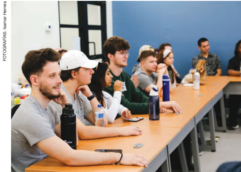
Estudiantes de la George Mason University y de la UACJ intercambiaron puntos de vista en torno a las condiciones que existen en la frontera de México y Estados Unidos.