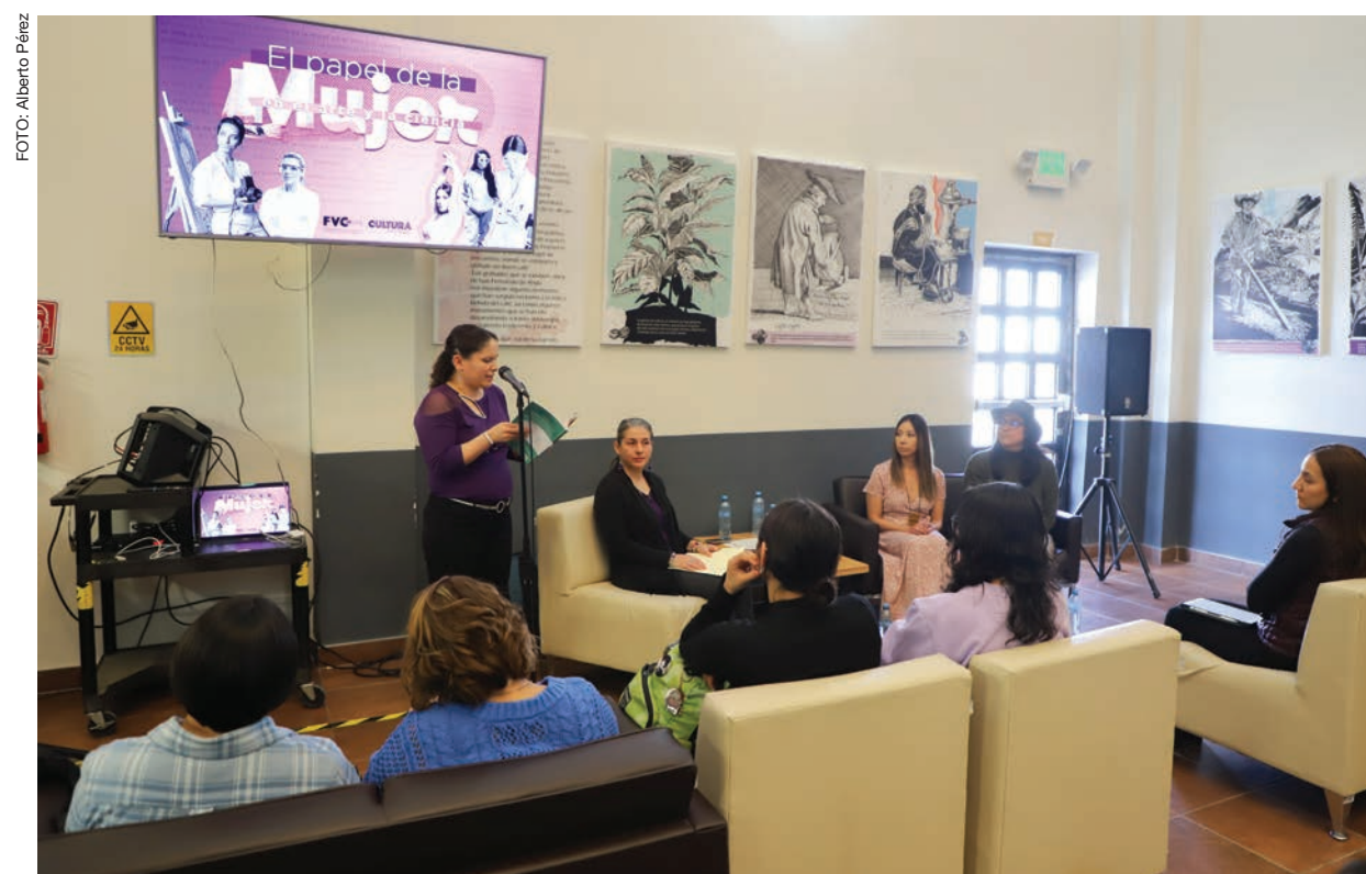
Mujeres profesionistas y artistas participaron en los conversatorios que se realizaron en el Centro Cultural de las Fronteras.