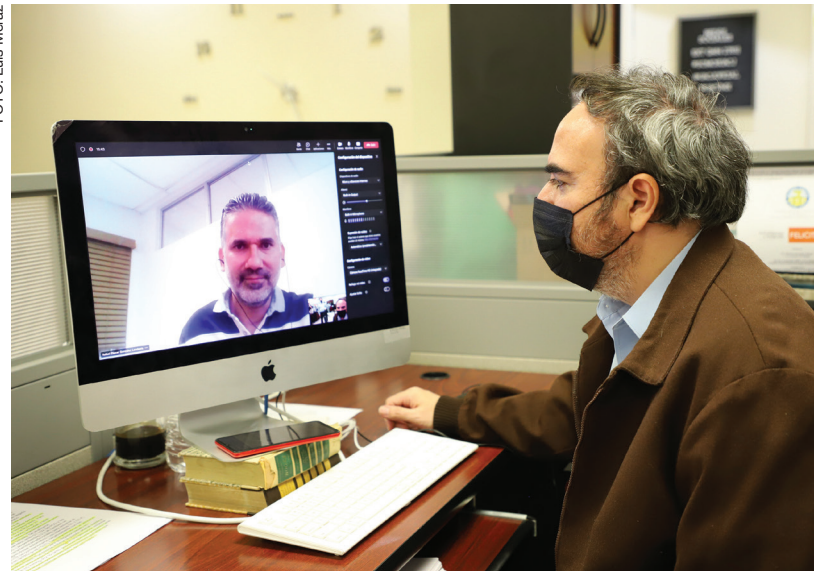
Los docentes darán continuidad a este proyecto, a través de una alumna que trabajará en el prototipo en físico de este método

ción médica; procesamiento analógico de señales; bioimpedancia eléctrica; recolección de energía; y análisis de ruido e interferencias en circuitos electrónicos.