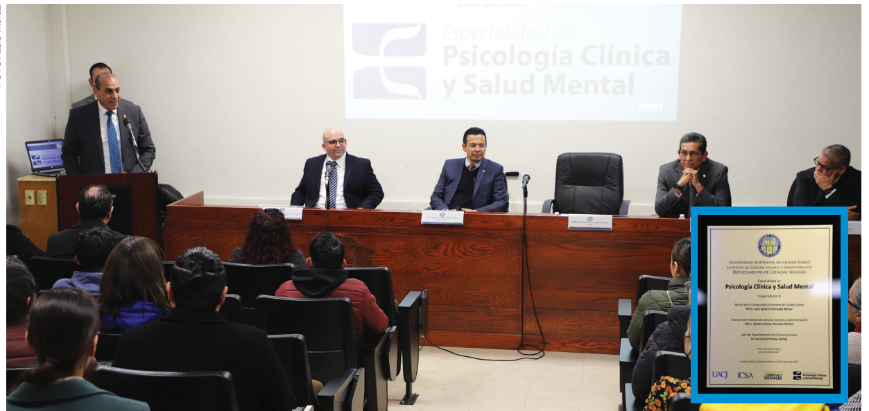
Autoridades universitarias asistieron al ICESA a la presentación formal de este programa educativo que inicia su primera generación este semestre