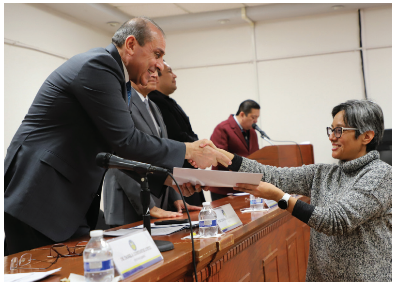
Autoridades universitarias reconocieron a los Consejeros Universitarios del periodo enero-diciembre 2022

Previo a la toma de protesta, celebrada el 25 de enero, se les exhortó a los Consejeros Universitarios que fueron electos el pasado mes de noviembre de 2022 —docentes, alumnos y suplentes—, a sentirse orgullosos del cargo que van a desempeñar, pero a que tomen conciencia de que a lo largo de su gestión sepan desenvolverse en los retos que los esperan, para lograr la