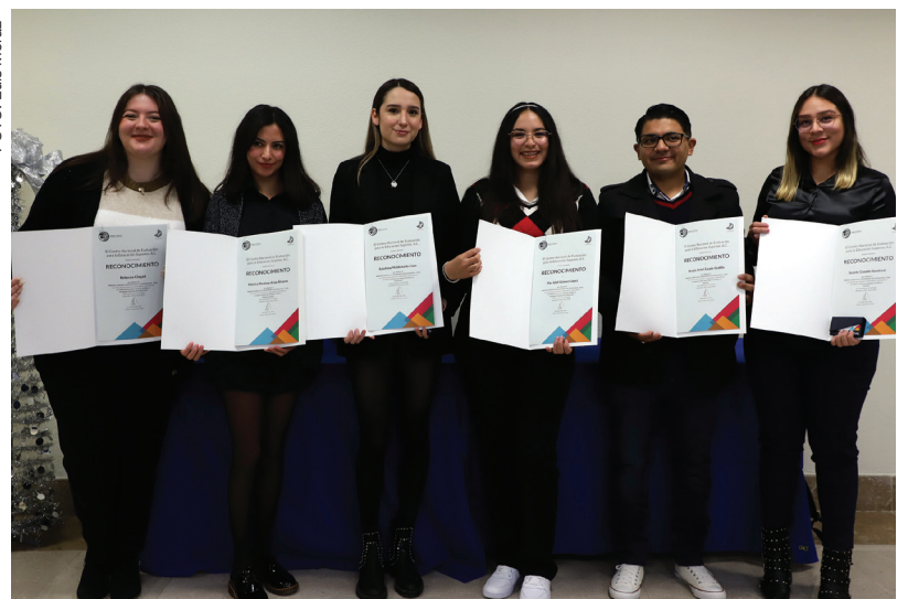
12 estudiantes obtuvieron este premio nacional durante el periodo diciembre 2021-mayo 2022