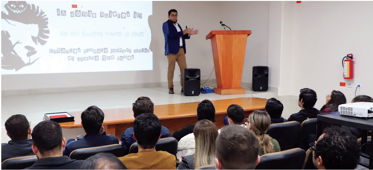
Tres ponencias enmarcaron este Encuentro, celebrado en el Instituto de Ciencias Biomédicas