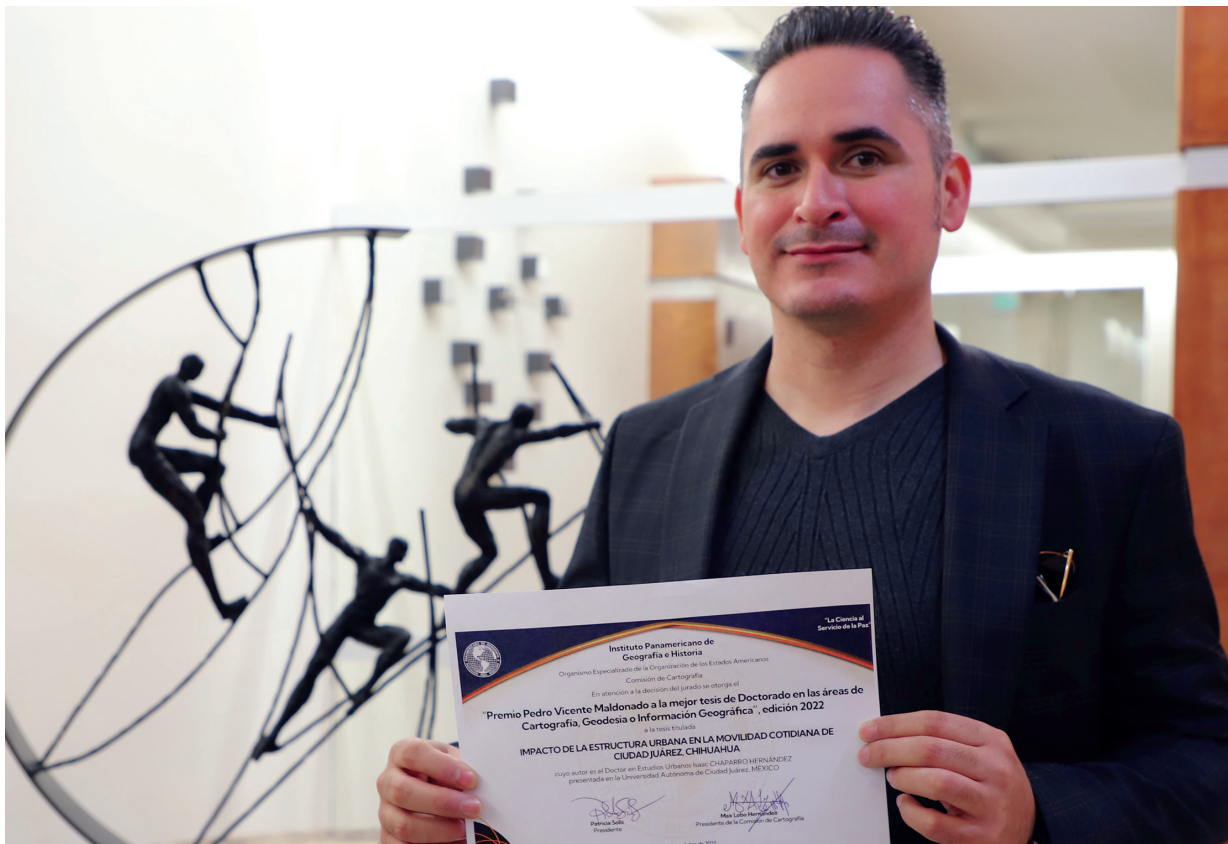
Además de ser docente de la UACJ, el doctor Chaparro también es egresado de esta casa de estudios