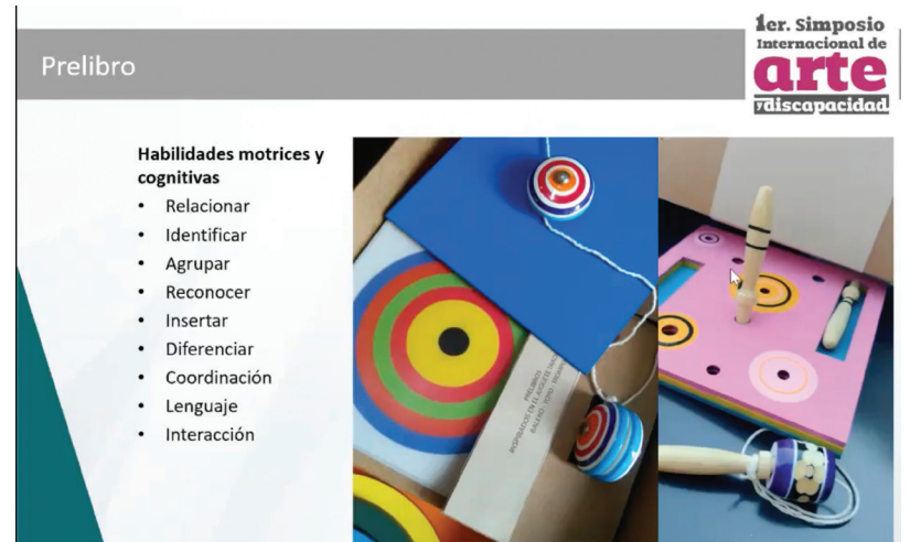
En el evento virtual participaron docentes del ICSA y del IADA