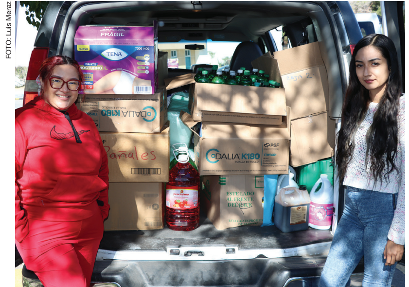
El donativo consistió en alimentos, artículos de limpieza e higiene personal

La respuesta a la colecta es un acto de responsabilidad social que se