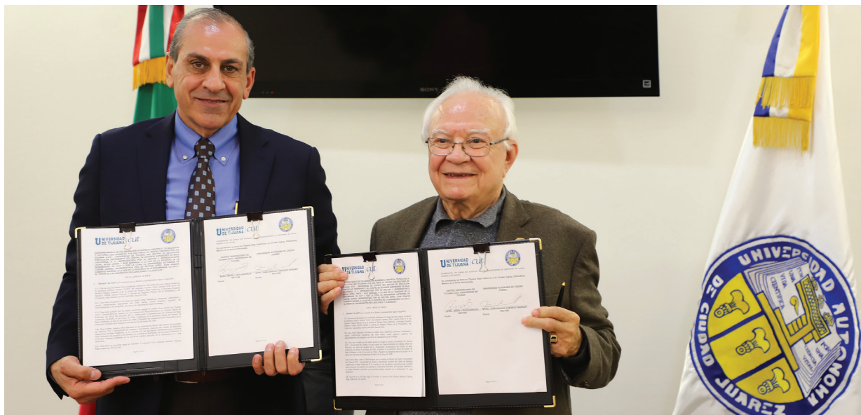
Presentan los rectores el convenio firmado y avalado

que “representa una oportunidad verdaderamente trascendente el poder venir a la UACJ, ya que es una Institución que se caracteriza por ser de las más prestigiadas en México”.