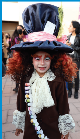
El evento tuvo como temática Disney-Pixar en Halloween

17 empresas, entre bares y restaurantes, patrocinaron la muestra: Great American Steak House; San Benito; ¡Viva México!; La Toscana; Alabama; Taquería y Cantina La Número 4; Kyosushi; Burritos El Centenario; Burritos El Compa; La Playita; Vips; Xolo's Tacos Co.; Clásicos Karaoke Rest.-Bar; Primer Piso; La Playa; Cinépolis; y Agencia de Viajes Patita de Perro. Para los niños que se dieron cita en el evento, la coordinación de la licenciatura asignó una serie de sorpresas, como pintacaritas, así como un show inspirado en las cintas más sobresalientes del conglomerado de entretenimiento estadounidense más grande del mundo.