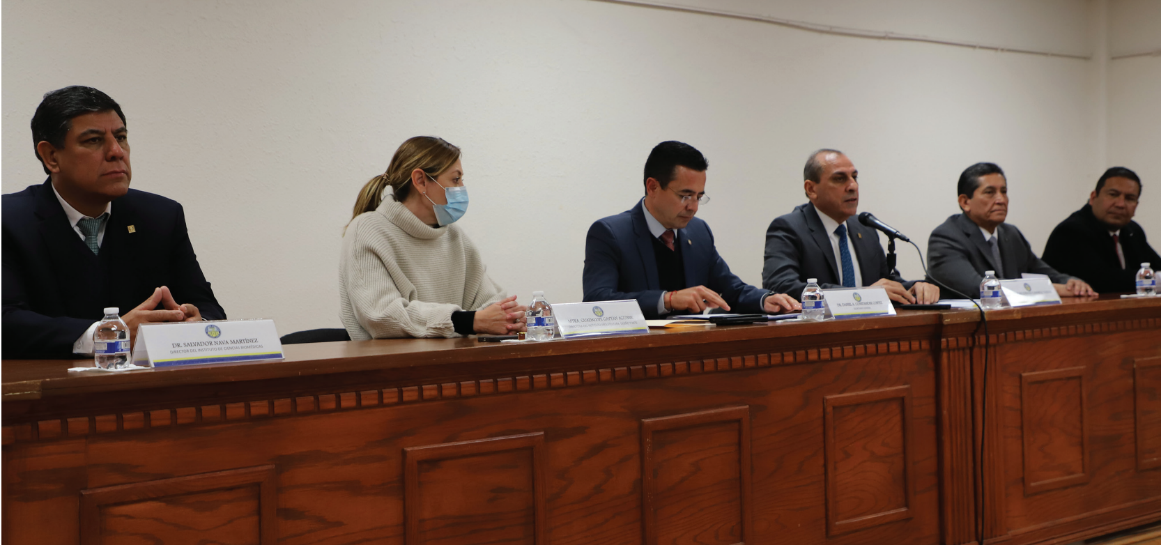
El presidium estuvo conformado por el rector de la UACJ, directores de instituto y el secretario general