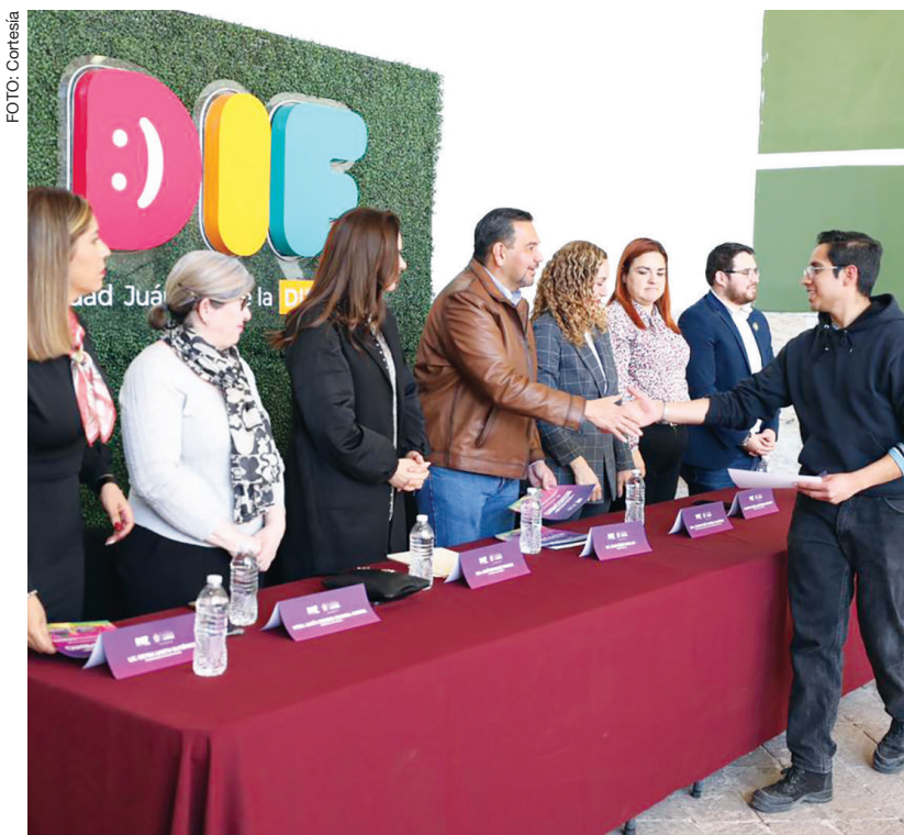
El evento se realizó en el Centro Cultural Ernesto Ochoa Guillemard

Tras atender a 215 mil juarenses en la Villas Navideñas 2022, el gobierno municipal y el Desarrollo Integral de la Familia (DIF) llevaron a cabo una entrega de reconocimientos a los estudiantes de la Universidad Autónoma de Ciudad Juárez (UACJ) que prestaron su servicio social en este proyecto, en un convivio celebrado el 11 de enero.