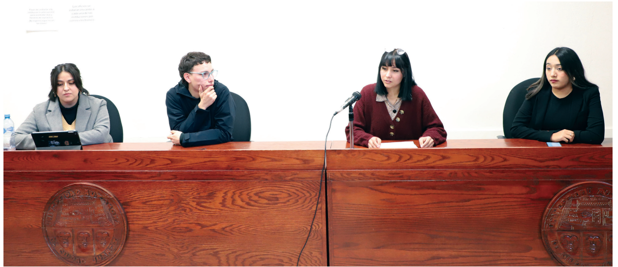
21 alumnos de Psicología presentaron casos de esta frontera