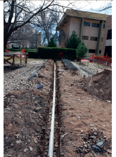
A mediados de agosto inició esta instalación en el ICSA

Actualmente, la línea morada se extiende por la avenida Malecón y llega hasta la zona de Anapra; además, se extiende por la avenida Valle del Sol y por la zona residencial de Campos Eliseos.