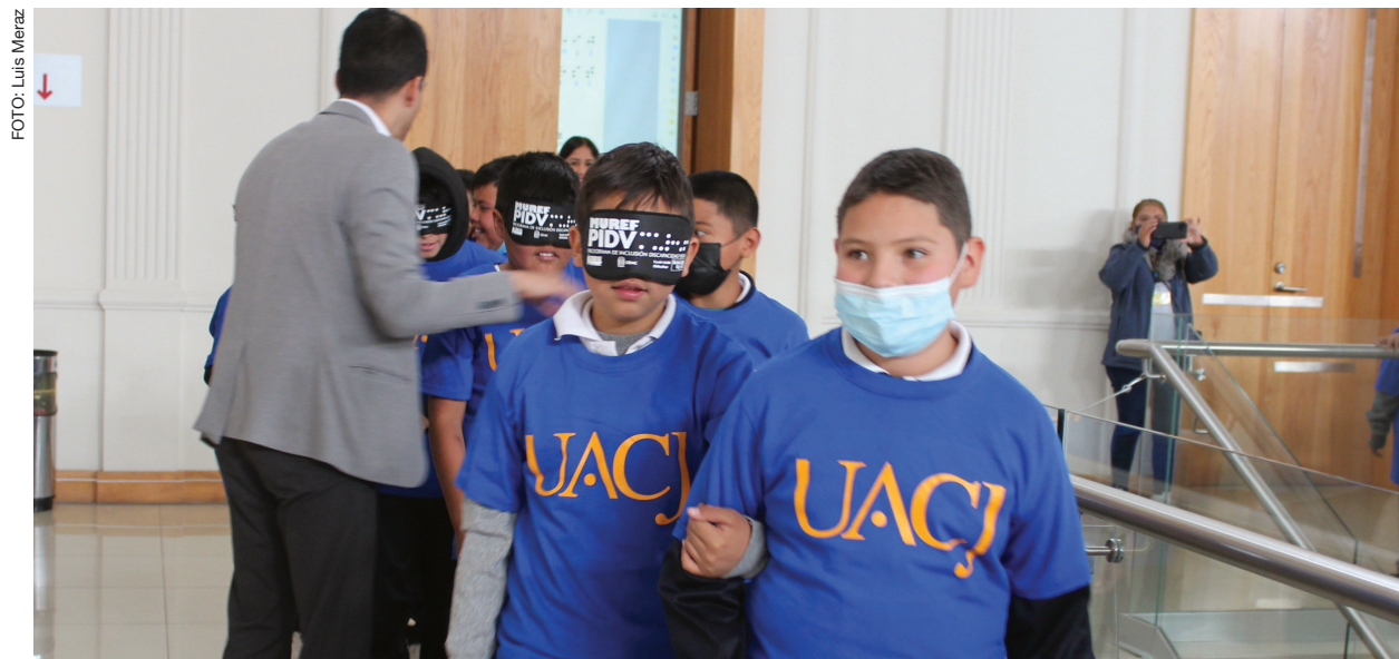
Alumnos de la primaria Guadalupe Victoria durante una actividad en el museo