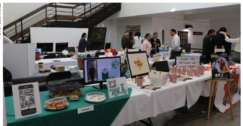
El evento se realizó en el Centro Cultural de las Fronteras

“En ella (la obra), los personajes son las mismas madres que demandaron a Ciudad Juárez, entonces viene una parte de la Corte Interamericana donde la sentencia fue en contra, no solo de esta urbe a nivel municipal, sino también estatal y nacional.