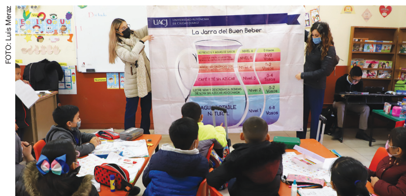
Alumnos de la UACJ explicando la Jarra del buen beber

“En una segunda visita a la misma escuela, se habla con los padres de familia para invitarlos a que integren